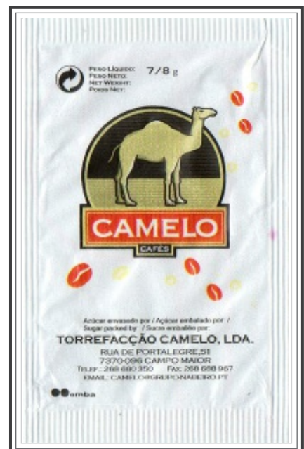
Verso Comum ( 02 e 04 )