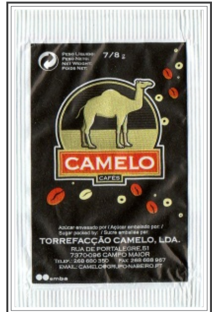
Verso Comum ( 01 e 03 )