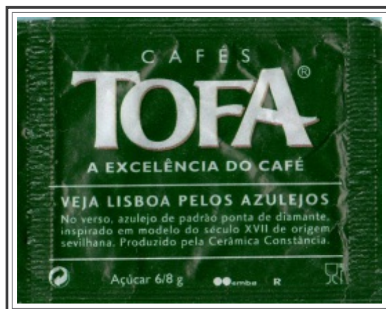
Exemplo de Verso ( 01 a 06 )