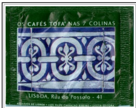
03. LISBOA, Rua do Possolo - 41

Azulejo de padrão ponta de diamante inspirado em modelo do século XVII de origem sevilhana. Produzido pela Cerâmica Constância.