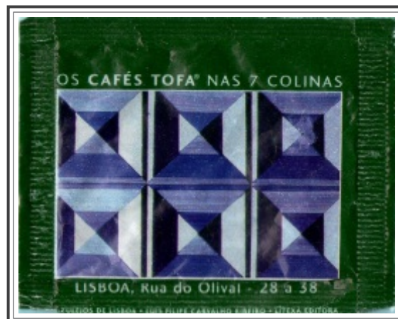
02. LISBOA, Rua do Olival - 28 a 38

Painel de padrão com desenho geométrico e policromático, inspirado nas composições de "alicatado" hispano-mouriscas.