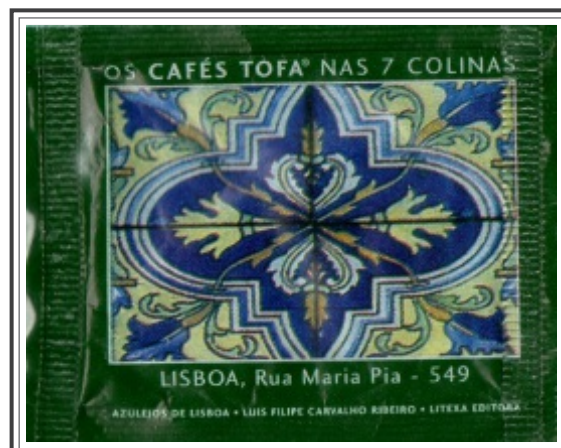
06. LISBOA, Rua Maria Pia - 549

Exemplar único da Quinta dos Prazeres de ornamentação policromática com motivos vegetalistas. Produzido por técnica de estampilha.