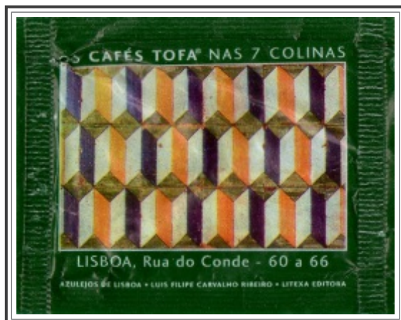
01. LISBOA, Rua do Conde - 60 a 66

Painel de padrão com desenho geométrico e policromático, inspirado nas composições de "alicatado" hispano-mouriscas.