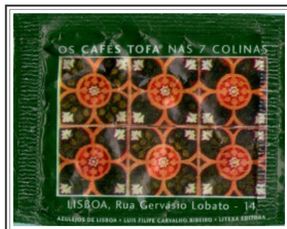
04. LISBOA, Rua Gervásio Lobato - 14

Cercadura de remate de ornamentação monocromática com motivos geométricos vegetalistas. Produzida por técnica de estampilha.